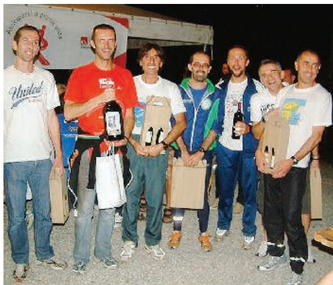
Premiazione e partenza del «Circuito dei Celti»